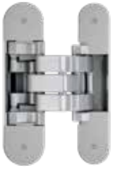
IN570130V703 Plata Satinado