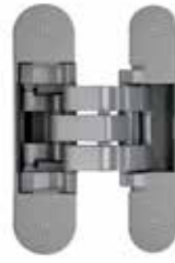
IN570130VN03 Niquelado Satinado